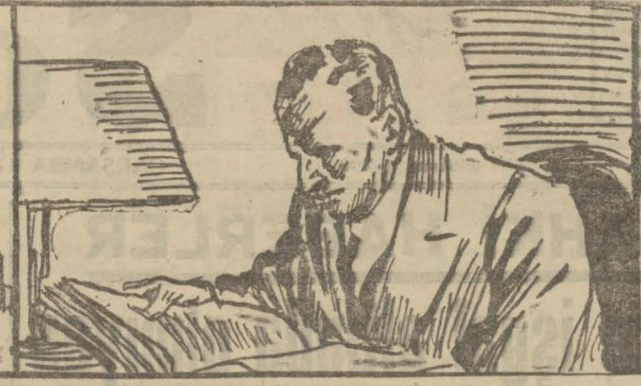
Bizde değişen işe muhit değil, meslek ve san'attır.

«Bir adam hakiki yolunu bu'ancıya kadar muhit değiştirebilir, ve değiştirmelidir derler, ve bu nazariyeyi filiyata geçirerek bir kanun halinde görürler. Fakat muhit değiştirmeyi hiç bir zaman meslek ve ihtisas değiştirmek manasına almazlar.»