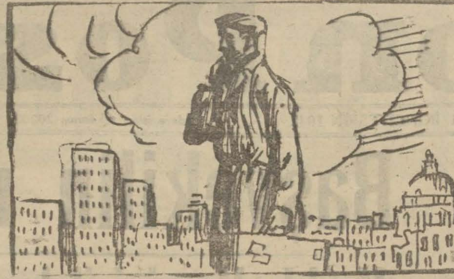
Amerikada umami bir iş felsefesi vardır:

«Bir adam hakiki yolunu bu'ancıya kadar muhit değiştirebilir, ve değiştirmelidir derler, ve bu nazariyeyi filiyata geçirerek bir kanun halinde görürler. Fakat muhit değiştirmeyi hiç bir zaman meslek ve ihtisas değiştirmek manasına almazlar.»